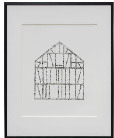
Betonfachwerke 2021 9 Schwarzweißfotografien auf Barytpapier, je ca. 30 x 40 cm gerahmt hinter Glas im Passpartout je 50 x 40 cm Auflage: 3+1AP