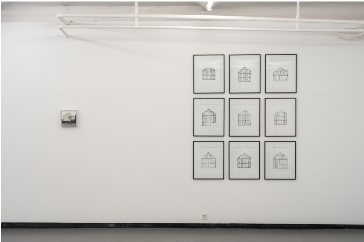
Ausstellungsansicht: Solo XIII Bastian Schwind „a scratch on the surface“ 2022 Fotogalerie Wien